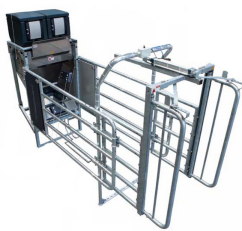
Nedap Dairy Management