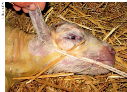
Si la tête est mal placée, bloquer la cordelette derrière les oreilles et dans la gueule de l'agneau.

Il faut alors essayer de sortir une patte et de la suivre pour trouver l'épaule puis la tête qui va avec. Repousser tout le reste qui appartient donc à un autre agneau. Ensuite corriger la position comme si l'agneau était seul. Poser des lacets peut éviter de « perdre » la patte ou la tête.