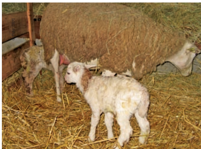
En présentation normale, les pattes avant et le museau arrivent en première position.

Une fois la décision prise : il faut se laver les mains, mettre des gants s'il y a eu des avortements ou si les pertes sont douteuses. Toujours faire preuve de douceur et de patience. Tant que le cordon est intact si la mère souffre, l'agneau souffre aussi. On ne gagne rien à vouloir aller trop vite.