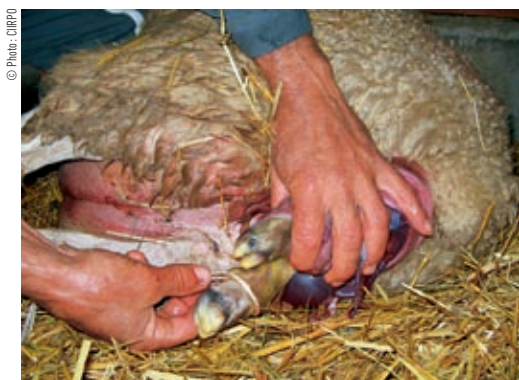
Pour tirer plus facilement sur les pattes, faire une boucle avec une cordelette, la remonter au-dessus des ergots puis tirer doucement.

Fiche réalisée par Delphine Daniel, vétérinaire formatrice.