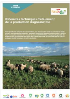
Fiche technique sur les itinéraires de production