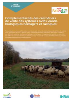
Fiche technique sur les calendriers de production