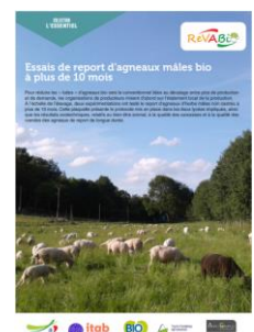
Fiche technique sur le report d'agneaux