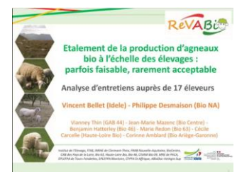
Diaporama sur l'acceptabilité des itinéraires par les éleveurs