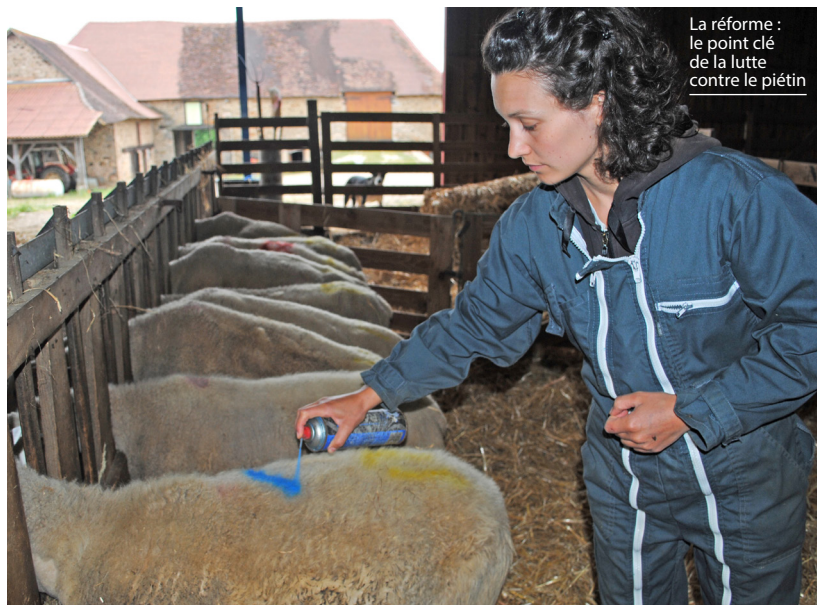
La réforme : le point clé de la lutte contre le piétin

Pour repérer les récidivistes : couper un coin de la boucle à chaque fois que la brebis est soignée.