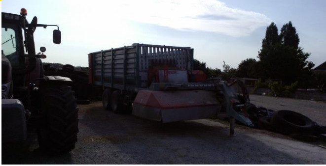
Récolte des couverts de mars à juillet puis de septembre à décembre au GAEC Guillet grâce à l'autochargeuse.