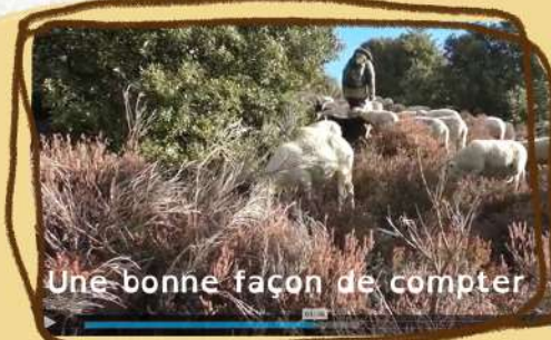
Une bonne façon de compter

On observe Julien à la garde, il rigole de lui même et nous explique qu'à ce moment là il était en train de se rendre compte qu'il lui manquait des animaux, comment s'en rend-il compte? 3min29