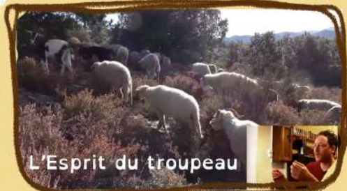
L'Esprit du troupeau

Comment construire son circuit de pâturage, établir son menu quotidien? Comment expliquer et utiliser la cohésion, l'unité, l'«esprit» du troupeau pour l'ingestion et la conduite de groupe?