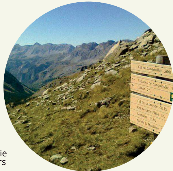
Col de Sanguinière