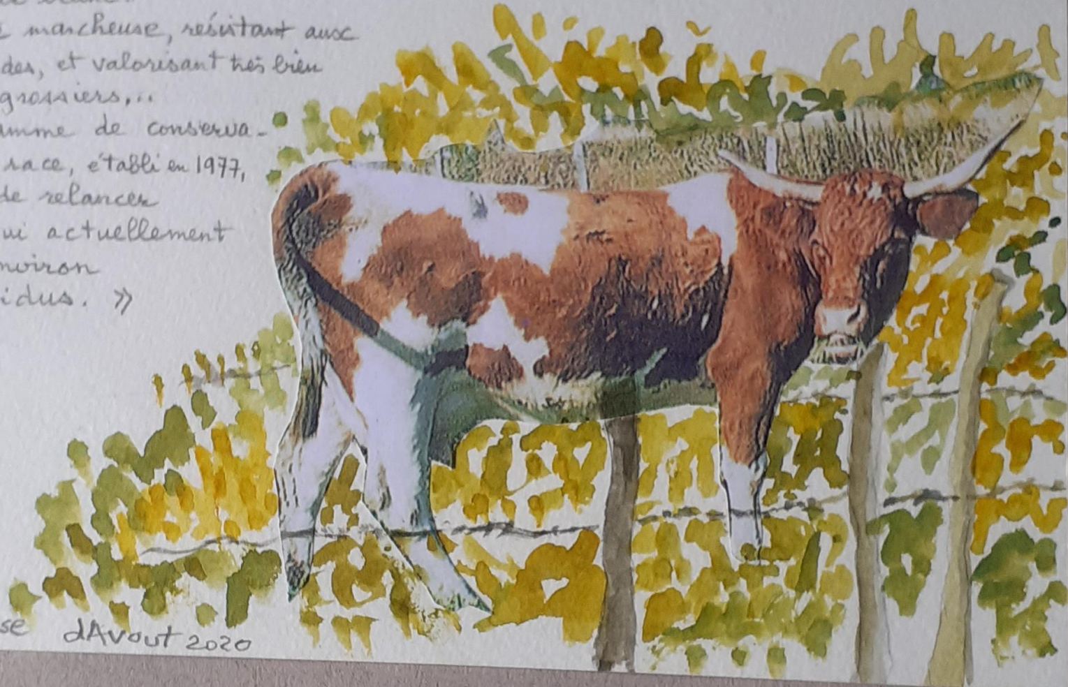
Vache Ferrandaise d'Avout 2020

Le programme de conservation de la race, établi en 1977, a permis de relancer l'espèce qui actuellement comporte environ 250 individus. »