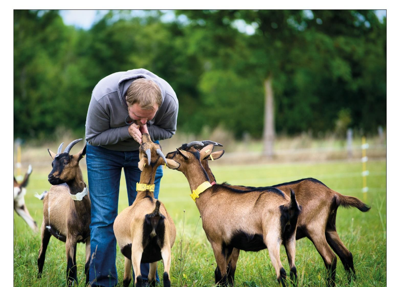
T'es de beaux yeux, tu sais, ma belle abéline Les chèvres aiment le contact et le rapprochement. Cet éleveur répond à cette attente (liberté 5) de l'espèce et noue une relation particulière avec ses chèvres.

Chaque photo est accompagnée d'une légende en lien avec une des 5 libertés. La relation entre l'éleveur et ses animaux a été illustrée dans de nombreuses photos proposées par les participants.