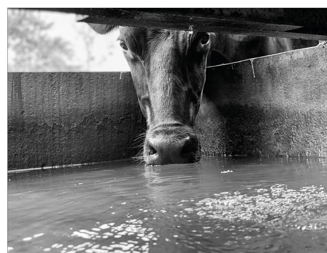
Avec ces changements climatiques, il fait sacrément souff certains jours ! Un éleveur propose, une eau claire et fraîche, voilà de quoi satisfaire la liberté 4 ! Certains éleveurs aujourd'hui, installent des ports d'eau supplémentaires pour les périodes de canicules.