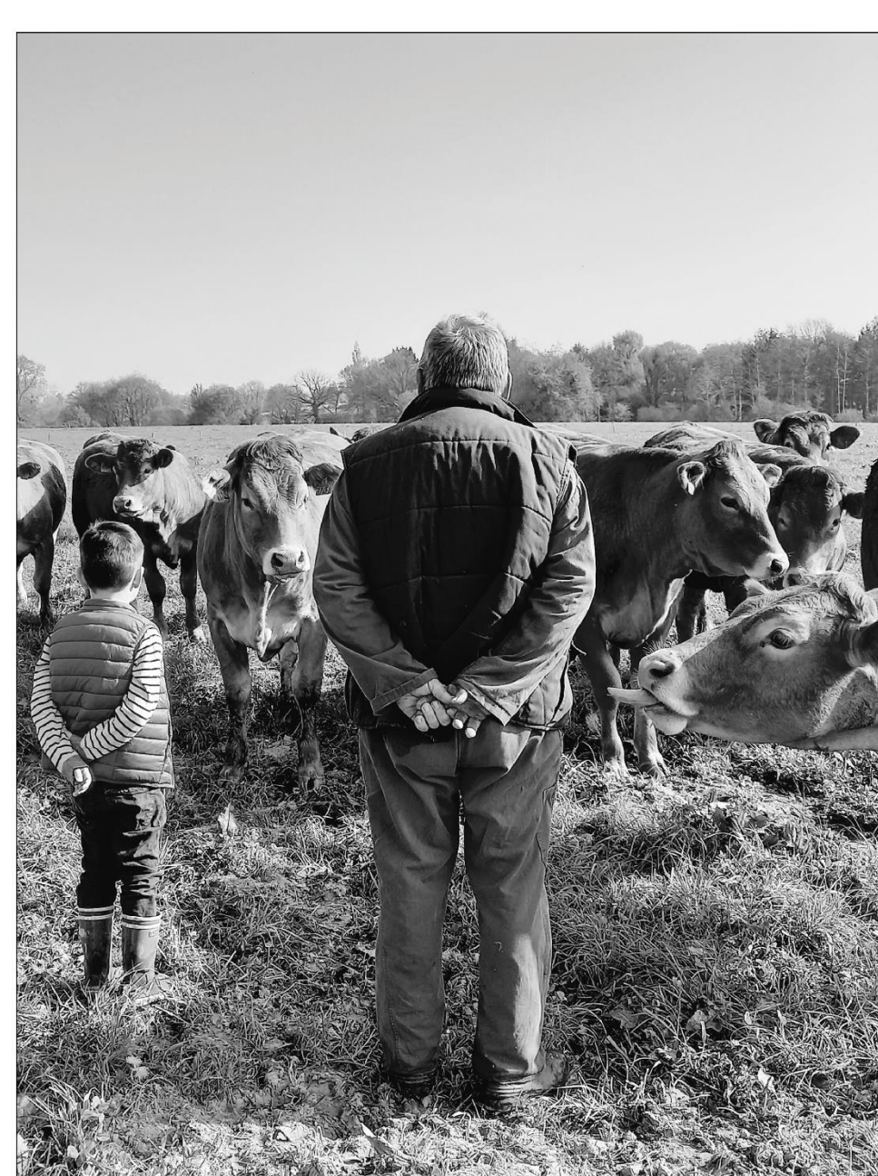
Nos vaches sont bien tranquilles, en parfaite santé et regardent cette coquette qui arrive. L'éleveur et sa femme passent du temps à côtoyer leurs animaux, permettant à chaque animal de la sorte de chaque animal (liberté 5) et entraînant une relation de confiance avec leurs vaches (liberté 5).