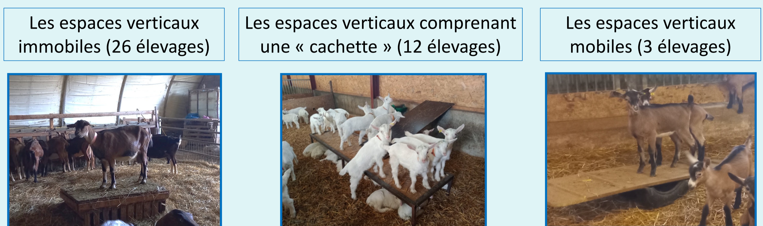
Figure 3 : Les différents types d'espaces verticaux rencontrés

Des espaces verticaux (plateformes, bancs...) ont été observés dans 29 élevages et présentent une forte diversité (Fig. 3). Ils permettent, selon les éleveurs possédant ces aménagements, la réalisation de différents comportements : grimper, jouer, mettre en place la hiérarchie, se cacher.