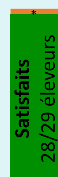
Figure 4 : Taux de satisfaction

*Correspond à un éleveur qui constate que les chevrettes sautent par-dessus les barrières