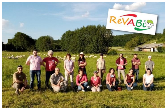
Les membres de ReVABio ont pu visiter la ferme du lycée agricole de Vendôme (EPL 41).

En France, la demande en agneaux bio est toujours bien présente sur la période de Pâques (mars-avril) et, dans une moindre mesure, en décembre. L'offre peine ainsi à répondre à la demande en début de printemps, mais elle est importante en mai et juin, et surtout à l'automne, à la sortie des agneaux nés au printemps et élevés à l'herbe. Pour inciter les éleveurs à proposer plus d'agneaux autour de Pâques, certains opérateurs économiques (abatteurs, groupements de producteurs, coopératives) offrent une prime pour les agneaux produits en mars-avril.