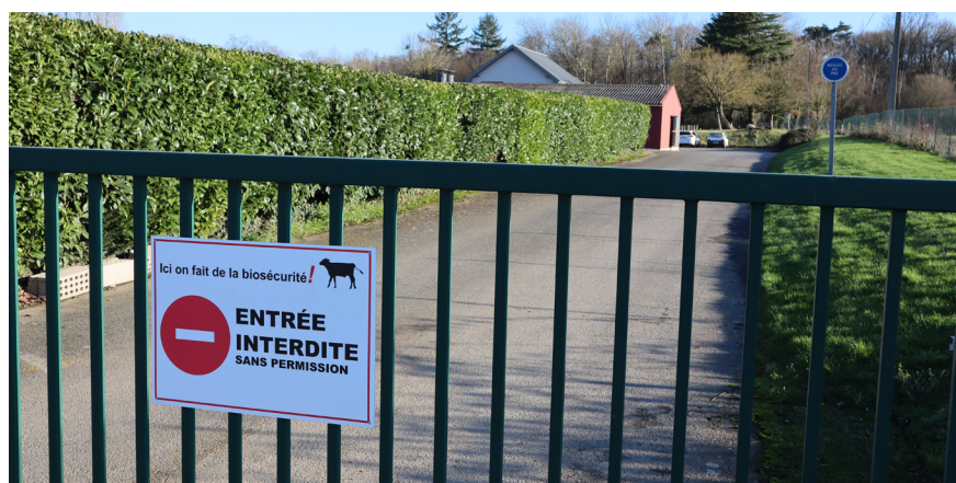
Exemple de panneau de biosécurité à l'entrée d'un élevage de veaux de boucherie

Il faut également tenir compte de la direction des vents dominants : les sources potentielles de contamination doivent se situer à l'opposé du sens des vents dominants. Il est nécessaire de bien orienter les bâtiments d'élevage et de positionner les entrées d'air de façon à limiter l'exposition des veaux aux sources de contamination extérieures, notamment en prenant en compte la position de la fosse à lisier et/ou de la fumière.