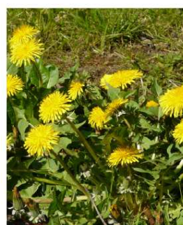
PISSENLIT début de floraison