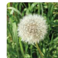
PISSENLIT en graine