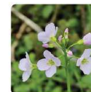
CARDAMINE DES PRÉS