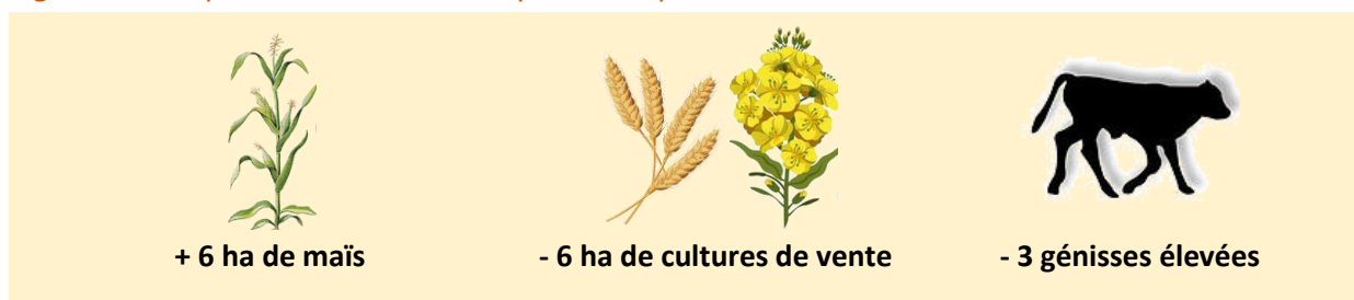
Tableau 4 : Évolution sur l'utilisation des surfaces fourragères et résultats économiques attendus, en comparaison avec la situation à court terme