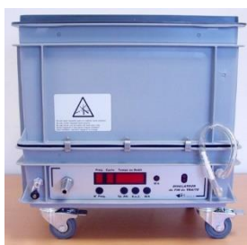
Simulateur de Fin de Traite (SFT)

Vignette apposée à l'issue d'un Dépos'Traite®