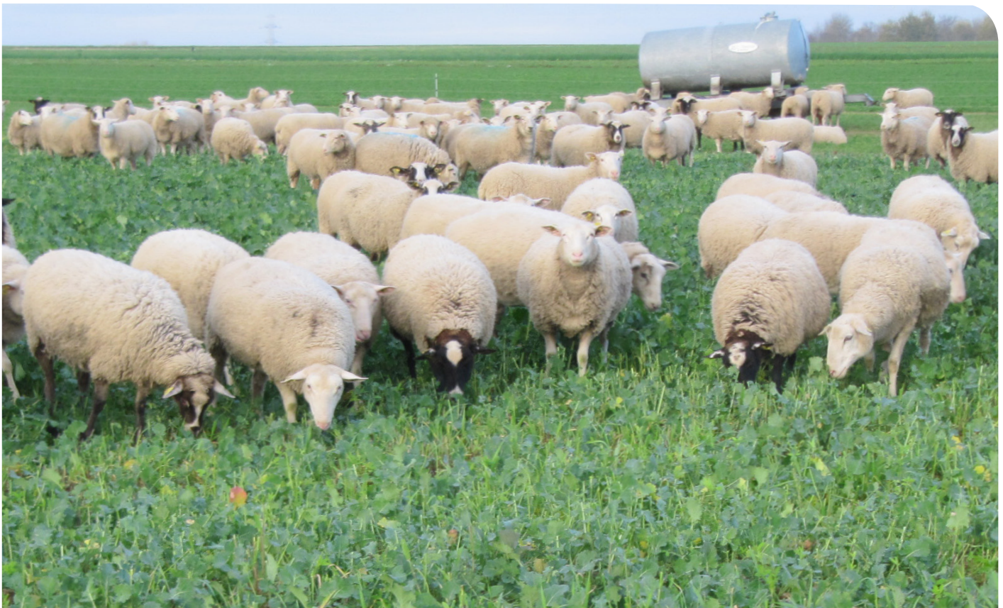
Un pâturage de de septembre à mars sur les couverts végétaux

À découvrir sur idele.fr , les plantes qui se pâturent sans contrainte et celles à éviter ↙