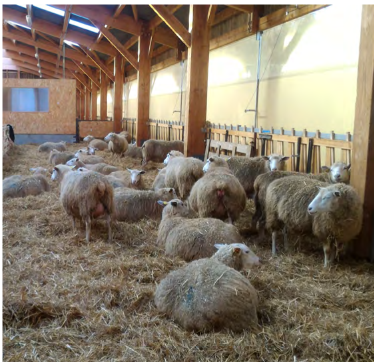
Les six dernières semaines de gestation : une phase clé

*Rations au cours des 3 dernières semaines de gestation avec du foin de graminées de qualité moyenne distribué à volonté (0,6 UFL ; 55 g e PDIN et 70 g de PDIE par kg de matière sèche)