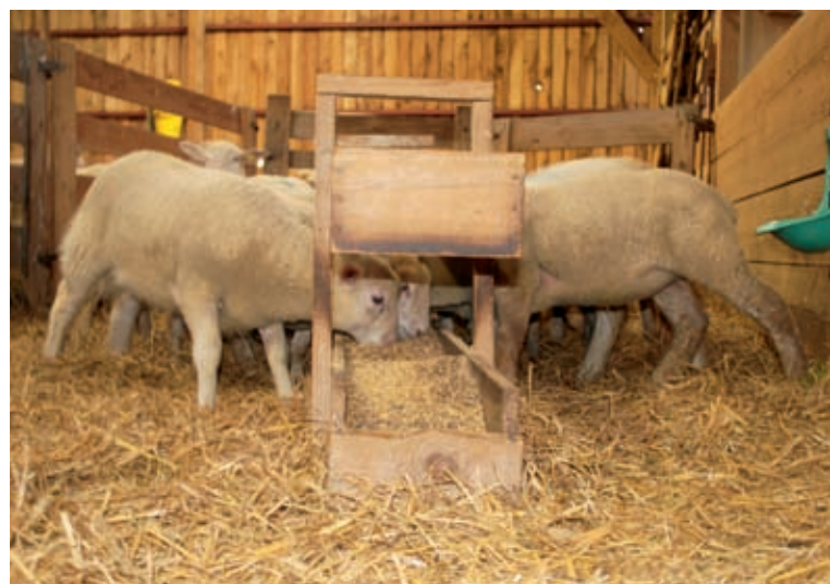
Le même aliment peut être utilisé de 15 jours d'âge jusqu'à la commercialisation