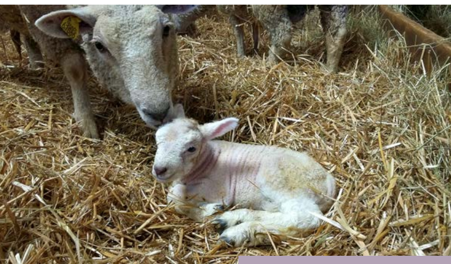
LA BREBIS RECONNAÎT SON AGNEAU À LA VUE ET À L'ODEUR

L'adoption n'est pas toujours couronnée de succès mais certaines méthodes offrent plus de réussite que d'autres. Cette fiche vous propose quelques exemples.