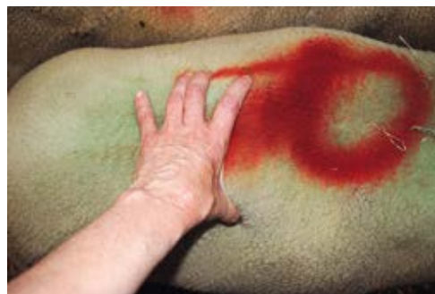
Brebis présentant un bon état d'engraissement

Dans un contexte très favorable et avec des brebis de bonne conformation et bien finies, le prix d'une brebis de réforme atteint 80 €, voir plus.