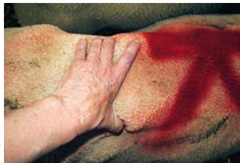
Brebis très maigre