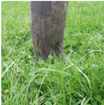
Avec de l'herbe courte et feuillue, l'apport de concentré est inutile