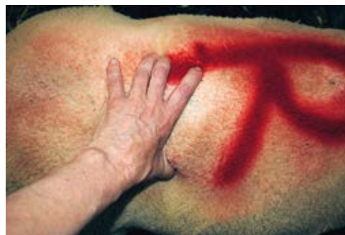
Brebis présentant un état d'engraissement moyen