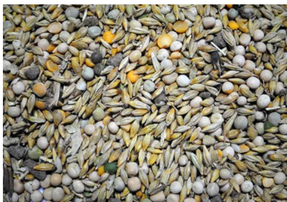
Un mélange orge/pois avec 42 % de pois