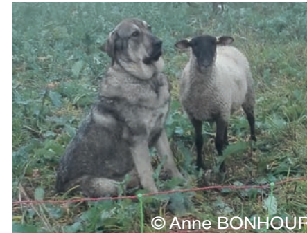
Cão de Gado Transmontano