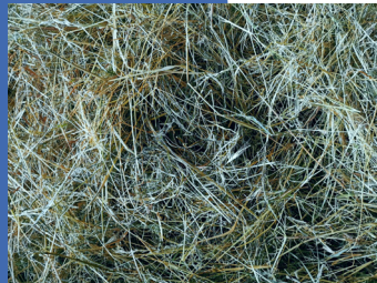
Bon foin de graminée