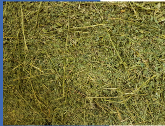
Bon foin de légumineuse