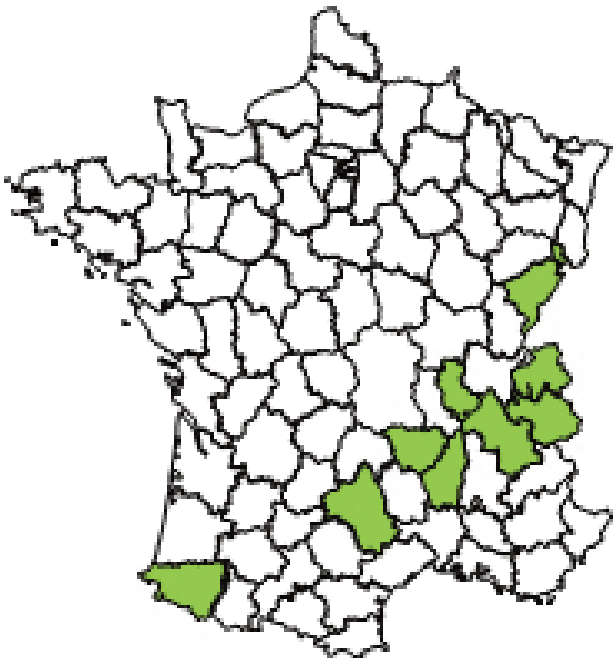
Les régions concernées par le projet

MontagneBio vise à faciliter et accompagner le développement de la production de lait biologique dans les zones de montagnes et piémonts françaises.