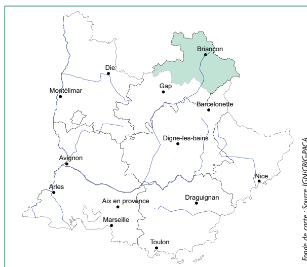
> Zone de présence

Ce type d'exploitation principalement localisé dans les Hautes-Alpes (Haute vallée du Drac, Grand Briançonnais, Queyras) se retrouve aussi mais de façon plus diffuse dans les hautes vallées alpines des départements voisins (Ubaye, Haut Verdon,...). Le foncier est morcelé, les nombreuses parcelles sont de petites tailles, avec un grand nombre de propriétaires. Pour pallier ce morcellement, notamment sur les zones de pâture intermédiaires, les éleveurs se sont répartis les surfaces par quartier, ce qui permet une pratique de la vaine pâture à l'automne à partir de la descente d'alpage. Les terres cultivées de l'exploitation, souvent en prairies permanentes, ont un potentiel agronomique limité par la pente et l'altitude (supérieure à 1500 m), ce qui ne permet pas la culture de céréales. Un petit réseau d'irrigation gravitaire peut être présent sur une partie de ces surfaces. Le disponible pastoral de proximité est important. L'alpage, accessible à pied, est souvent regroupé en Association Foncière Pastorale et partagé avec les troupeaux transhumants. Les zones de parcours intermédiaires, sont très étendues et plus ou moins boisées. La dimension réduite du troupeau ovin, inférieure à 300 brebis, est calé sur la capacité