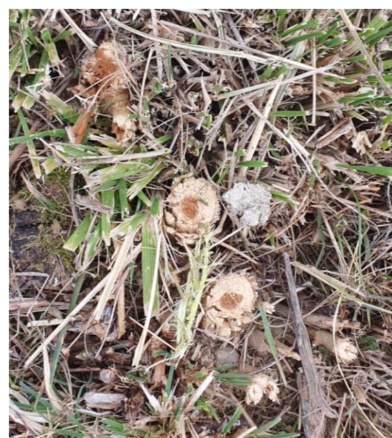
Cépée à la débrousailluse

2 ha de Mûriers Blancs plantés il y a 30 ans , et repartis tous les mètres avec des inter-rangs de 3 m (soit + de 3000 plants/ha).