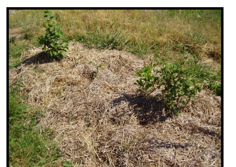
Paillage copieux (paille, foin, plaquettes, feutre, ...)