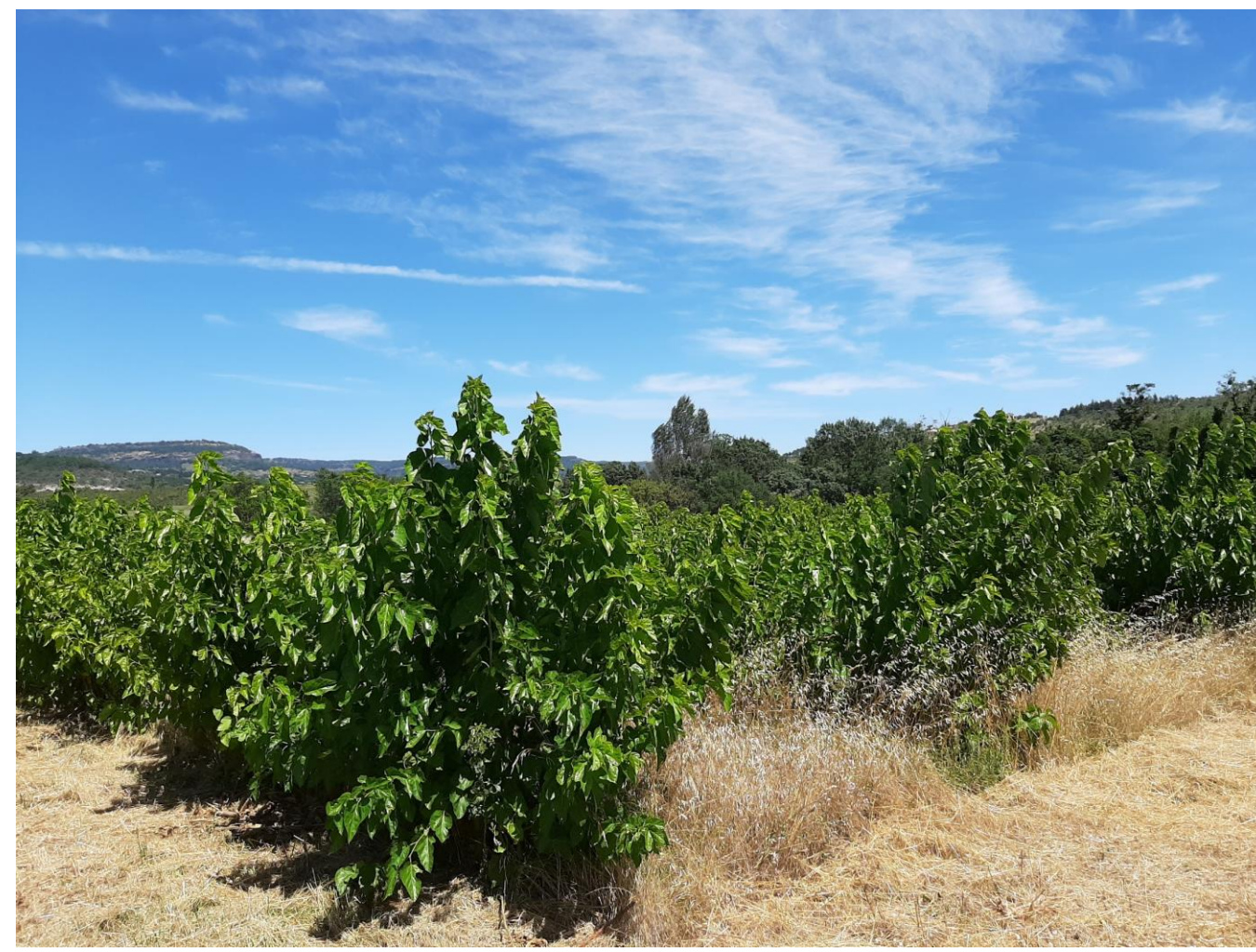
Pousses de Juillet