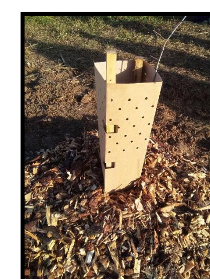
Plantation de jeunes plants (= meilleure reprise) + Protection anti-lièvre (optionnelle)