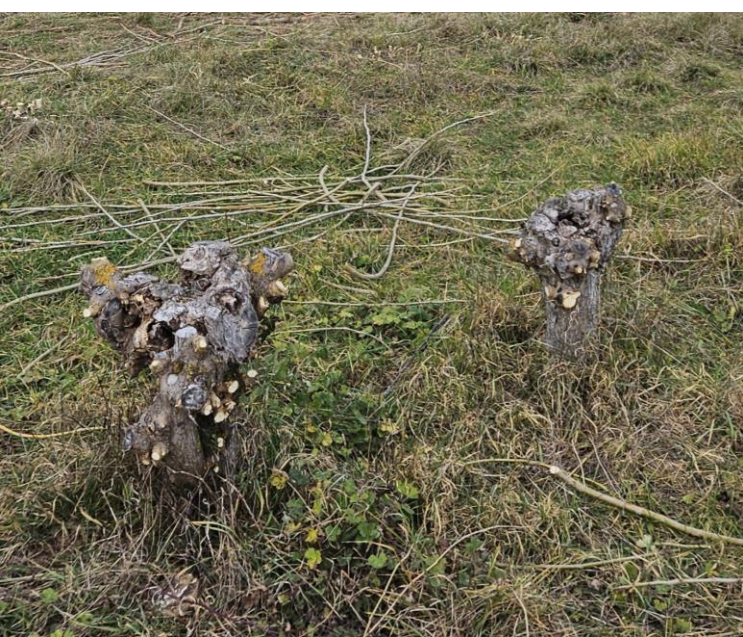
Têtard avec un sécateur