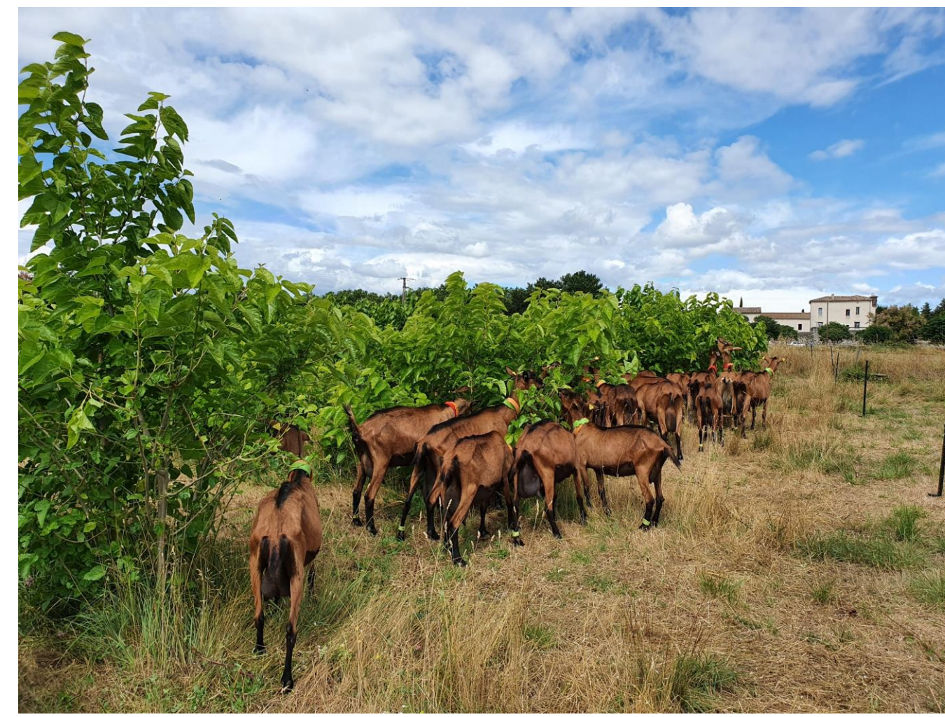
Pâturage des chèvres