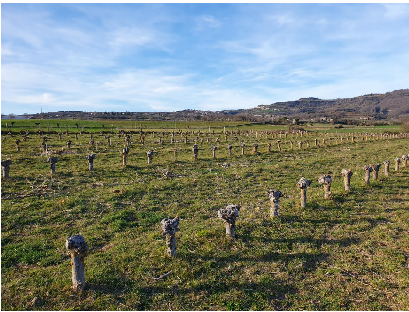
Taille à RAS en mars