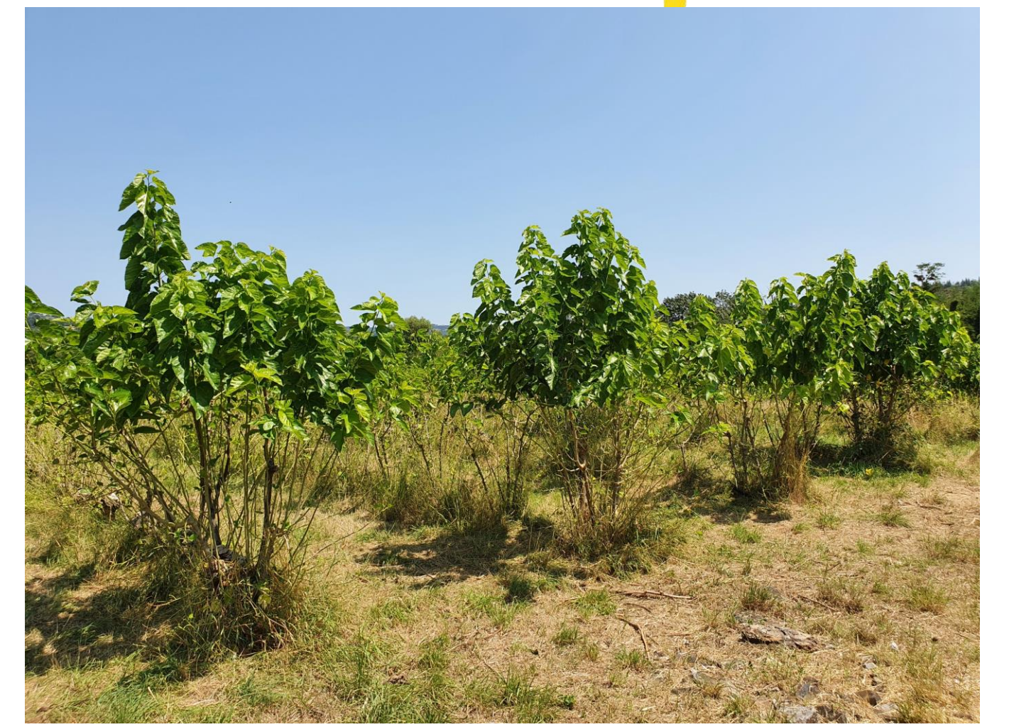
Après le pâturage