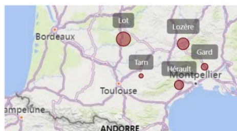
Fig. 1 : Localisation des exploitations