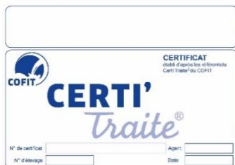
Plaque Certi'Traite®, apposée en cas de conformité

Certi'Traite® est un contrôle de conformité du montage et du fonctionnement à sec (hors traite) d'une nouvelle installation de traite . Il s'applique à toute installation de traite , du pot trayeur au robot de traite, achetée neuve , d' occasion (au moins un élément d'occasion) ou rénovée (ajout et/ou changement d'éléments), quelle que soit l'espèce laitière (bovins, caprins ou ovins). Certi'Traite® est une démarche volontaire (demande libre) du producteur , et parfois exigée par certaines laiteries ou structures et/ou pour répondre à des cahiers des charges (transformation au lait cru par exemple). Les OA 1 sous convention Certi'Traite® doivent obligatoirement le proposer à leurs producteurs, au mieux à la signature du bon de commande (avant début du montage en tout cas). L'un des agents de l'OA doit être présent lors du contrôle.