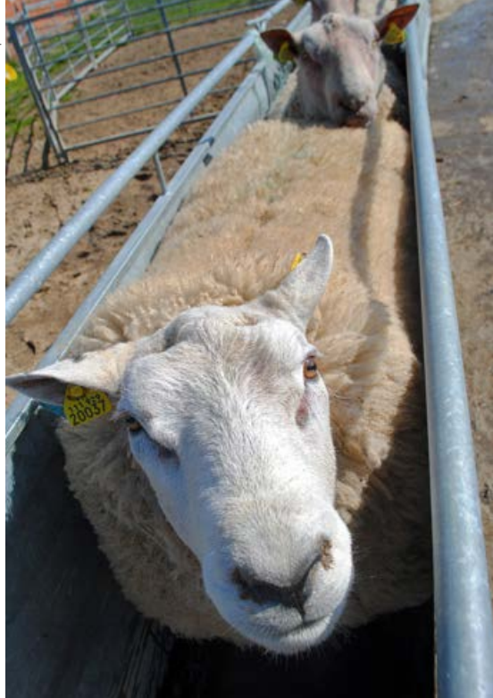
Les béliers sont préparés deux mois avant le début des luttes.