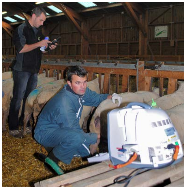
Un diagnostic de gestation 45 jours après le retrait des béliers.

Si vous avez l'habitude de luttes plus longues et souhaitez les raccourcir, il est utile de vérifier auparavant que 80 % des agnelages sont déjà groupés sur les deux premiers cycles sachant que la durée de gestation varie de 140 à 150 jours selon les brebis. Dans le cas contraire, le risque d'une contre-performance est non négligeable. Dans tous les cas, les luttes courtes sont associées à un diagnostic de gestation 45 jours après le retrait des béliers. Une lutte de rattrapage est alors en général possible.