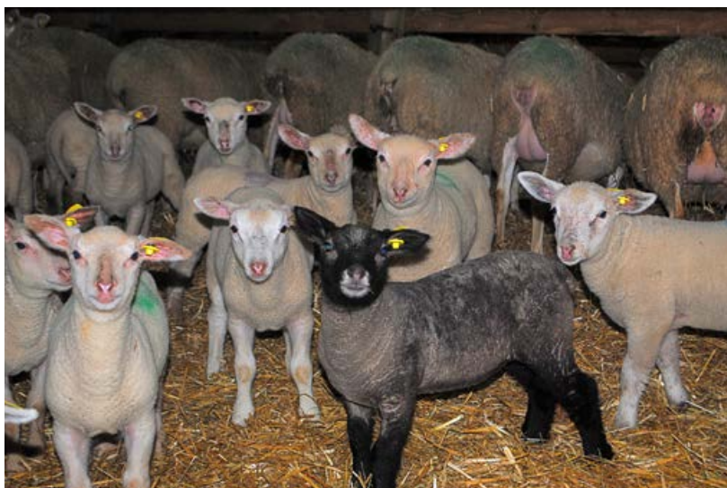
Avec des durées de lutte courtes, les lots d'agneaux sont homogènes.