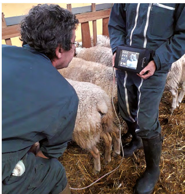
Un constat de gestation coûte entre 0,50 et 1,50 € par brebis

Associé à des luttes courtes, le constat de gestation est une technique devenue incontournable dans la gestion du troupeau. Séparer les brebis gestantes des vides et les alloter selon la taille de la portée sont des pratiques qui améliorent la marge brute.