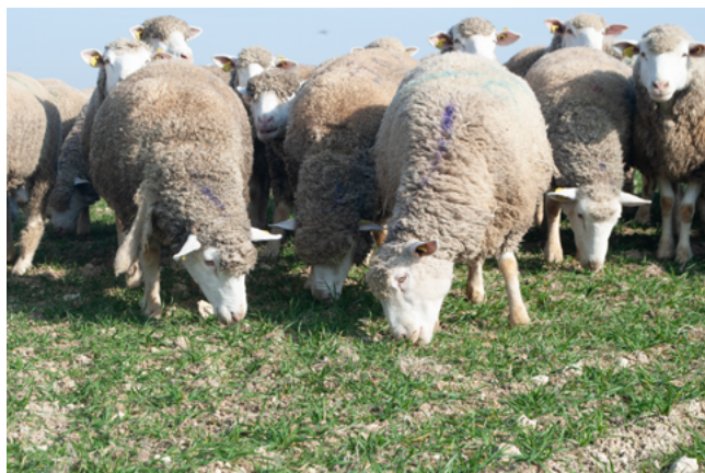
La biomasse à prélever reste faible

Le piétinement des brebis n'a que très peu d'impact sur la compaction du sol. En effet, si les mesures réalisées au test bêche indiquent une dégradation très légère après pâturage dans des conditions de sol humide et de portance moyenne (sol travaillé au semis du blé et pâturage sous la pluie), le score VESS (évaluation visuelle de la structure du sol) reste inférieur à un état compacté. Quant aux mesures par pénétrométrie, la différence de tassement sur le premier horizon à 8 cm est de l'ordre de 50 kPa, c'est-à-dire faible.