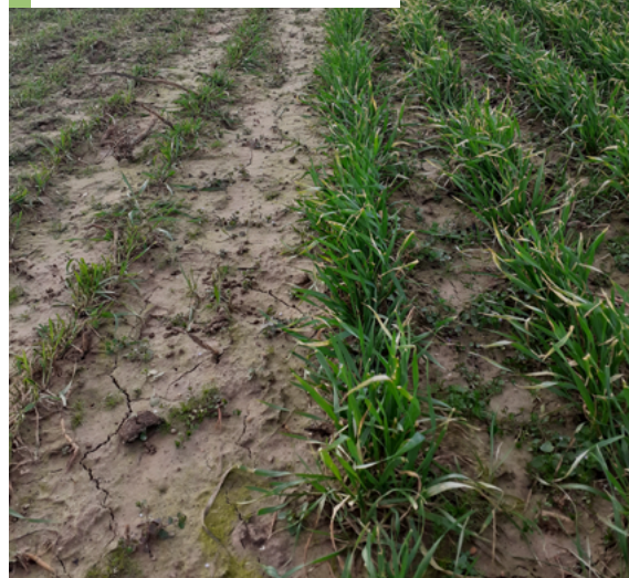
À gauche, la zone pâturée par les brebis

Ne pas dépasser le stade tallage pour des rendements en grains maintenus