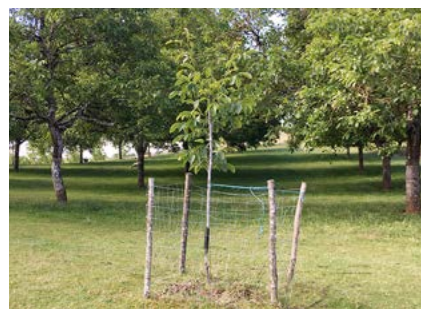
Protéger les jeunes arbres est une obligation

La protection des arbres doit être maintenue jusqu'à ce qu'ils aient atteint une taille suffisante, c'est-à-dire en général à 8 ou 10 ans. Les arbres recottés (jeunes arbres en remplacement dans un verger) sont impérativement à protéger avant l'entrée des brebis dans la noyeraie (photo ci-dessous). De plus, il est obligatoire de sortir les brebis 3 semaines à un mois avant la récolte pour éviter que les crottes ne salissent les noix. Certains cahiers des charges « acheteurs » peuvent l'exiger.