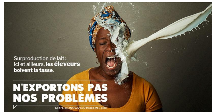
Campagne Oxfam, 2018