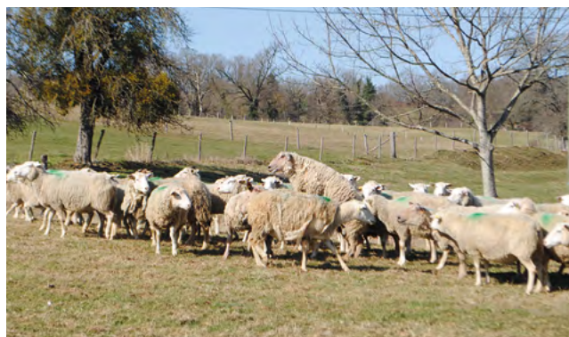
Stérile, le bélier vasectomisé doit être actif pour déclencher les ovulations des brebis.

D'autre part, seules les femelles de types désaisonnées répondent à l'effet mâle. En théorie, les races dites saisonnières y répondent très mal, voire pas du tout, à l'exception de certaines lignées. Enfin, les agnelles ne sont pas ou peu réceptives à l'effet mâle.