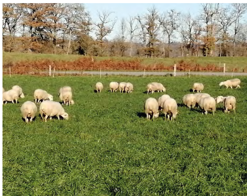
Seules les brebis de races desaisonnées répondent à l'effet mâle.

RÉPONSE : Aucune référence n'est disponible sur le sujet.