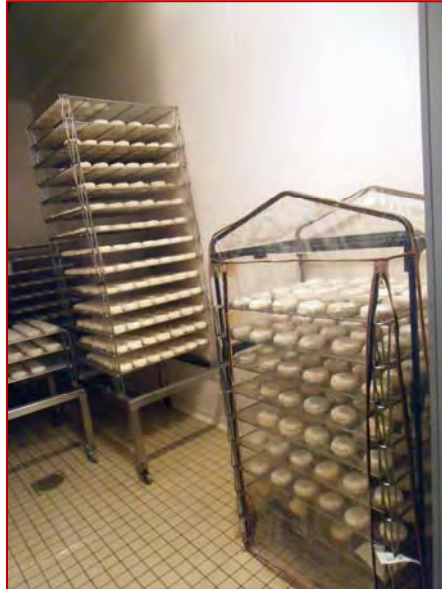
Photo 4 : serre de jardin utilisée pour créer une atmosphère confinée dans une zone du hâloir