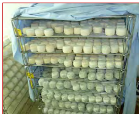
Photos 1 et 2 : pile de fromages recouverte d'un drap pour obtenir une ambiance plus confinée (ici pour bleuir les fromages)