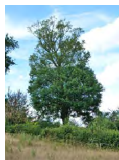
↑ 4 ans après