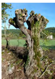
↑ Après élagage