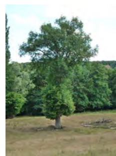
↑ 20 ans après