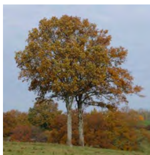
↑ Juste après la coupe