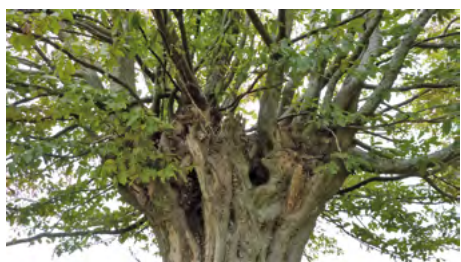
↑ Avant élagage