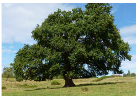
↑ Avant élagage