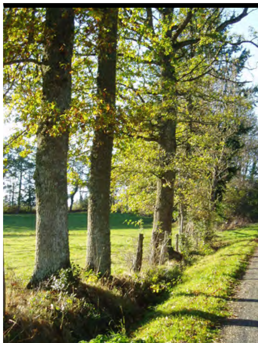
← Futaie régulière : un alignement d'arbres en croissance libre dans le Livradois Forez