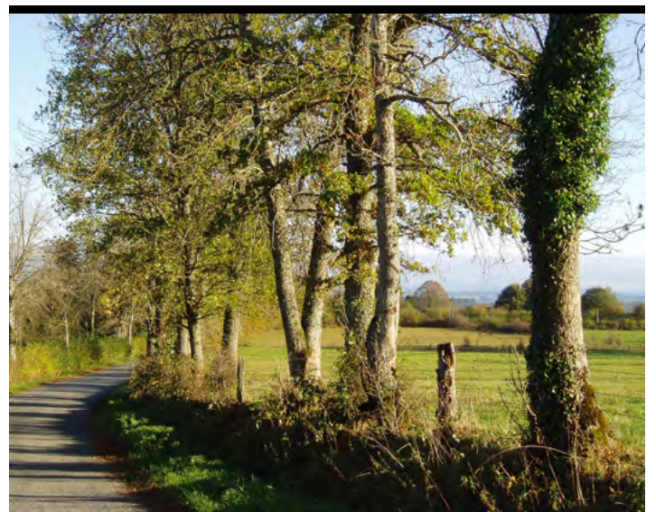
↑ Futaie irrégulière : un alignement d'arbres en croissance libre dans les Combrailles

Les futaies sont des alignements plus ou moins réguliers d'arbres de haut-jet. Ces derniers sont soit en croissance libre, soit cultivés pour la feuille ou le bois. On rencontre ces formes bocagères dans tout le Massif central. Les arbres peuvent être d'âges identiques (il s'agit alors de la futaie régulière) ou différents (futaie irrégulière). Les arbres en croissance libre sont des alignements d'arbres de haut-jet et d'arbustes. Ils ressemblent à une lisière forestière.