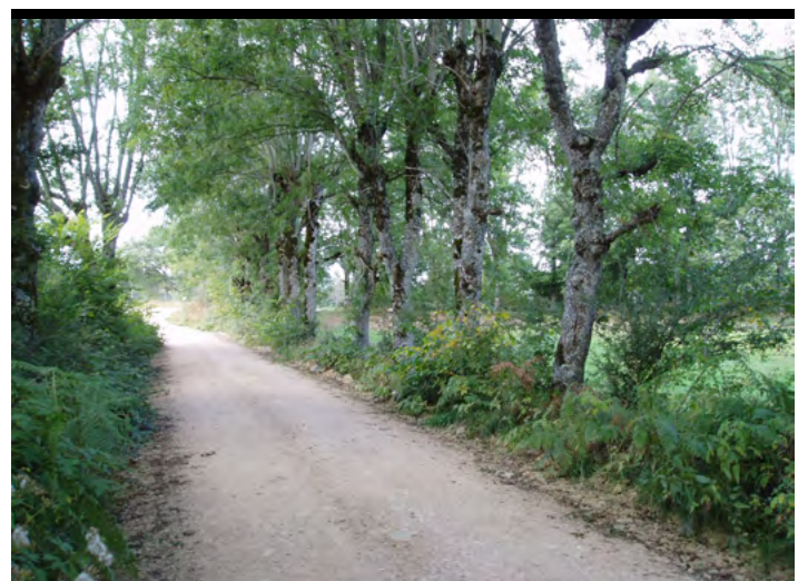
→ Futaie régulière : un alignement d'arbres cultivés (frêne émonde) dans l'Aubrac