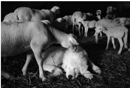
Sevrage à 8 semaines minimum et introduction dans son nouveau troupeau (animaux accueillants), sans congénère les premières semaines, pour favoriser l'attachement aux animaux