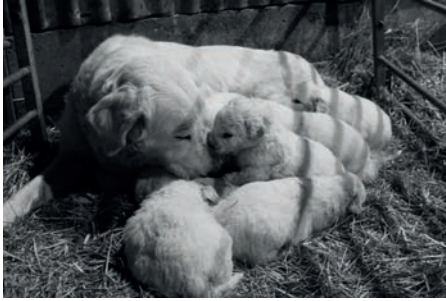
Socialisation au contact de sa mère et de sa fratrie

Pendant les premiers mois qui vont suivre sa naissance, l'environnement dans lequel va évoluer le chiot va être déterminant pour permettre le respect et l'attachement du chiot au troupeau, ainsi que le respect de l'humain.