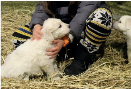
Familiarisation à l'humain