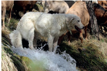
Berger de Maremme et Abruzzes