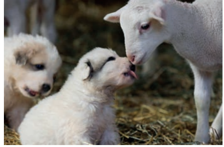
Imprégnation au troupeau