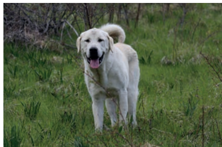
Berger d'Asie centrale