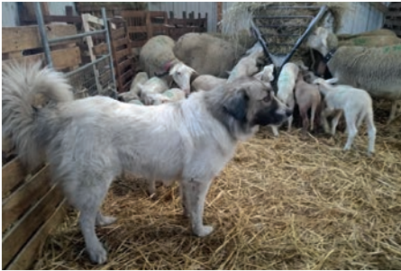
Montagne des Pyrénées

toutes les races de protection : chiens de type molossoïde (grande taille, tête assez ronde, oreilles pendantes et chanfrein relativement court) et forte réduction de certains patrons moteurs de la séquence de prédation.