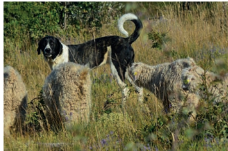
Cao de Gado Transmontano