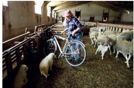
Familiarisation à différents stimuli