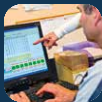
Bases de données et système d'information