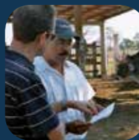
Zootechniciens et agronomes