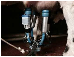
Appareil de mesure des variations de vide positionné sur un faisceau trayeur bovin