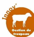
Schéma de production d'agnelles F1