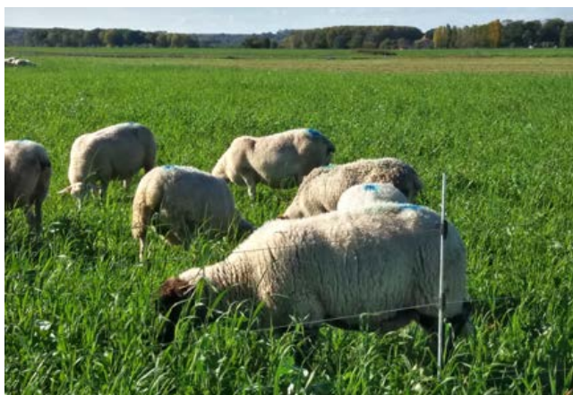
Un pâturage à la clôture électrique

En régions céréalières, les Cultures Intermédiaires Pièges À Nitrate (CIPAN) répondent à une exigence réglementaire et leur pâturage réduit les charges à la fois sur les ateliers ovin et céréaliier de l'exploitation. Leur rendement reste toutefois soumis aux conditions climatiques estivales, essentiellement la pluviométrie. Un mois et demi à deux mois après le semis, le couvert est prêt à être pâturé. Les brebis rentrent sur la parcelle « le ventre plein » puis pâturent jour et nuit sans transition alimentaire particulière sous réserve d'avoir semé des espèces non météorisantes en évitant la luzerne et le trèfle violet par exemple. Un rationnement quotidien n'est pas obligatoire, les brebis peuvent pâturer sur des parcelles de grande superficie.